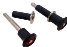
Sistema di ancoraggio rimovibile (opzionale)