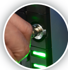
Blocchi interni all'accesso al contante