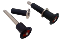
Abnehmbares Verankerungssystem (optional)