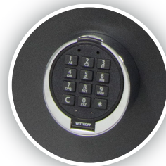
Chiusura elettronica temporizzata (opzionale)